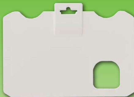
セキュアカードケース（背面）