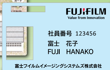
マスキングカード