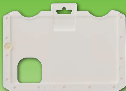
セキュアカードケース（表面）

マイナンバーカードを身分証や入館証などの IDカードとして利用する場合に最適です