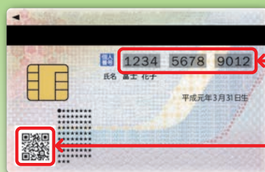
マイナンバーカードイメージ（裏）