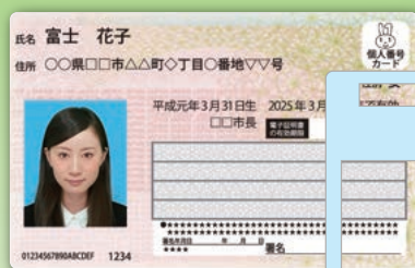
マイナンバーカードイメージ（表）